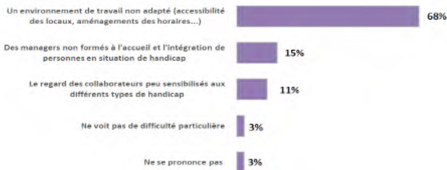
QUESTION - Selon vous, quelle est la principale difficulté à laquelle un travailleur en situation de handicap doit faire face dans son environnement de travail ?

De plus, la perception des Français à l'égard des entreprises en matière d'emploi et de handicap reste encore mitigée. Ainsi, 64 % des sondés considèrent que les entreprises ne mettent pas en place les actions nécessaires pour permettre le recrutement des personnes en situation de handicap. Dans les faits, le taux d'emploi des personnes en situation de handicap dans le secteur privé est de 3,1 %, loin des 6 % imposés par la loi 3 . Pourtant, on observe une réelle amélioration de la prise en compte du handicap au sein des entreprises. Ainsi, 92 % d'entre elles emploient directement ou indirectement des personnes en situation de handicap aujourd'hui 3 . Le montant